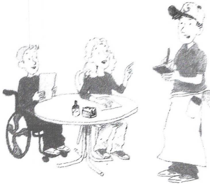
Illustration: Volker Lippert/5. Edition